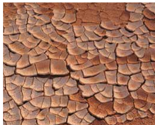
L'agriculture est également victime du changement climatique, avec des sécheresses plus fréquentes.

Lors d'un récent Briefing de Bruxelles sur le développement 1 , des experts ont mis en lumière les politiques nécessaires pour aider les agriculteurs à faire face au changement climatique. Les gouvernements devraient promouvoir des politiques en faveur d'une agriculture « intelligente face au climat », c'est-à-dire une agriculture capable de s'adapter à ses évolutions comme d'en atténuer les effets. Ils devraient en encourager l'adoption grâce à des mesures d'incitation financière. Ils devraient également adopter une approche multisectorielle pour faire face à l'impact du changement climatique sur les systèmes alimentaires. Ils devraient encourager la recherche sur les meilleures solutions permettant aux agriculteurs de réduire les émissions de gaz à effet de serre et d'adapter leurs pratiques aux évolutions du climat. Enfin, au niveau international, l'agriculture devrait être au cœur des négociations sur le changement climatique.