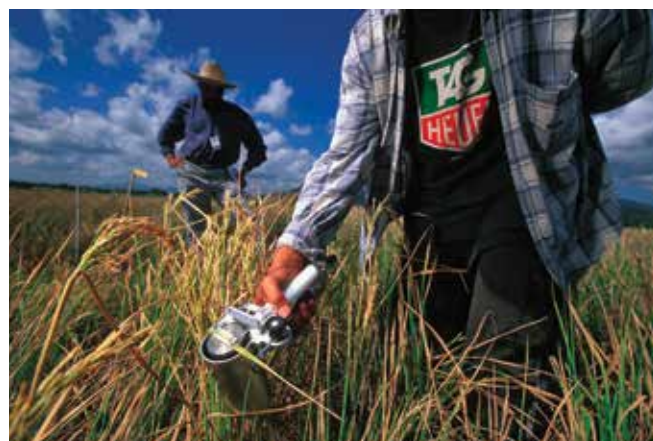
Des scientifiques récoltent des données sur différentes variétés de riz hybride soumises à des tests de simulation aux conditions de sécheresse.

Les politiques destinées à aider les agriculteurs à faire face au changement climatique doivent s’adapter à des situations diverses, du village au pays, et donc, à diverses échelles biophysiques, de l’exploitation elle-même au bassin hydrographique. Fréquemment, cela nécessitera une coopération entre diverses entités administratives et politiques, ce à quoi on assiste déjà dans certaines régions ACP. En 2002, par exemple, les chefs d’État des Caraïbes ont établi le Centre du changement climatique de la Communauté des Caraïbes. Il coordonne l’approche régionale du changement climatique et encourage la collaboration entre les ministères, les agences de recherche, les groupes d’agriculteurs et les organisations non gouvernementales.